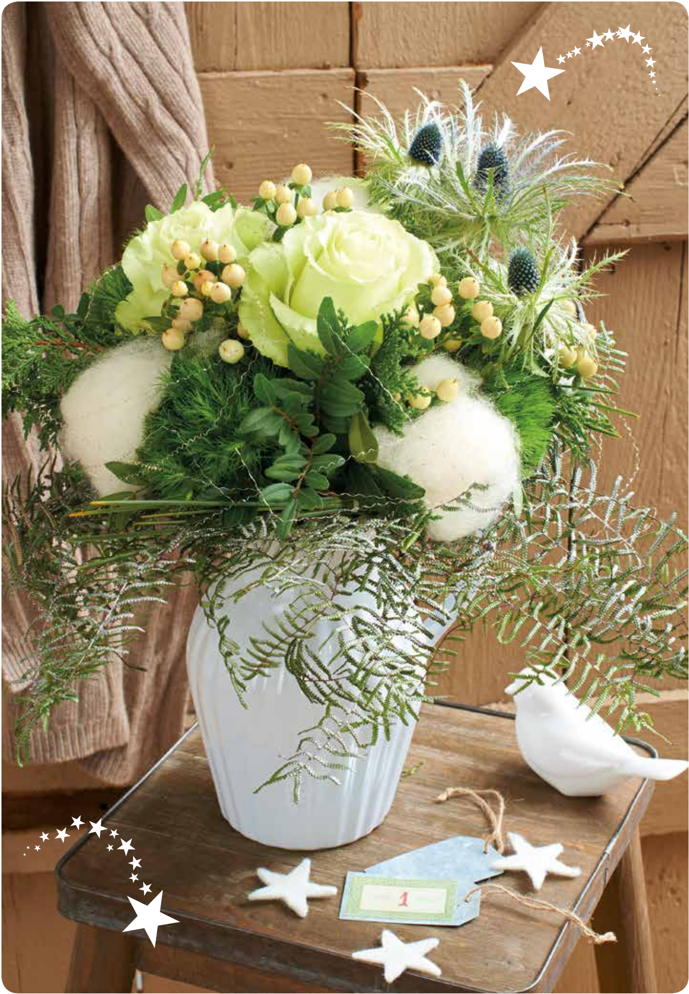
Idee, Design und Realisation: Christiane Rudolph; Fotos: Tanja Gasch