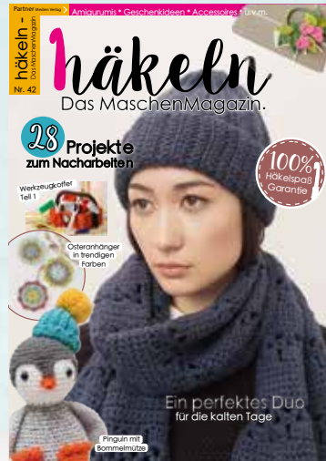
Häkeln Nr. 42