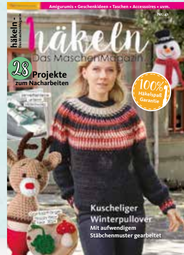
Häkeln Nr. 41