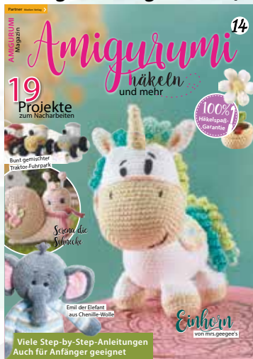
Amigurumi Magazin Nr. 14