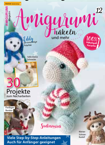
Amigurumi Magazin Nr. 12