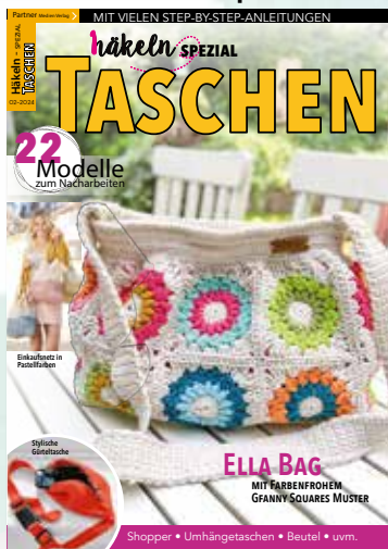
Häkeln SH 2/24 Taschen