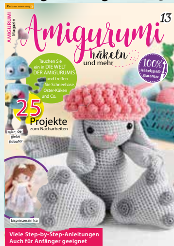
Amigurumi Magazin Nr. 13