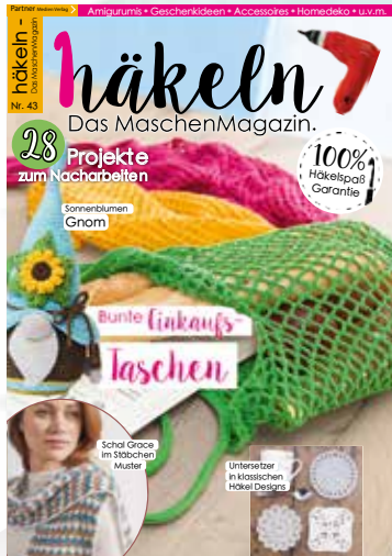
Häkeln Nr. 43