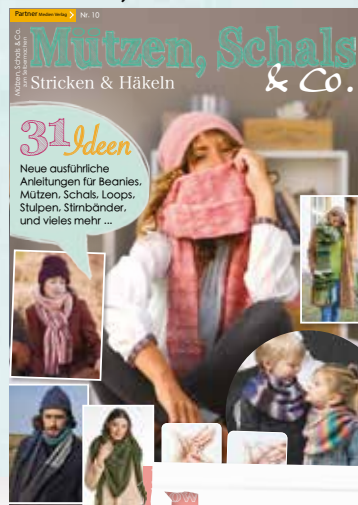
Mützen, Schals & Co. Nr. 10