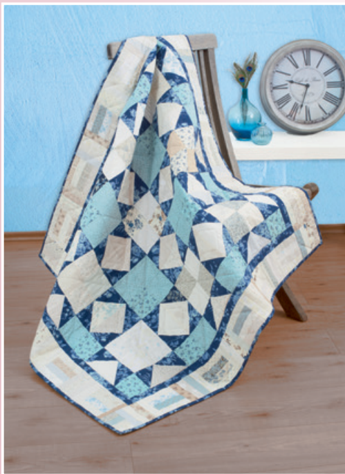
Vintage Blue – Quilt von Christina Wagner