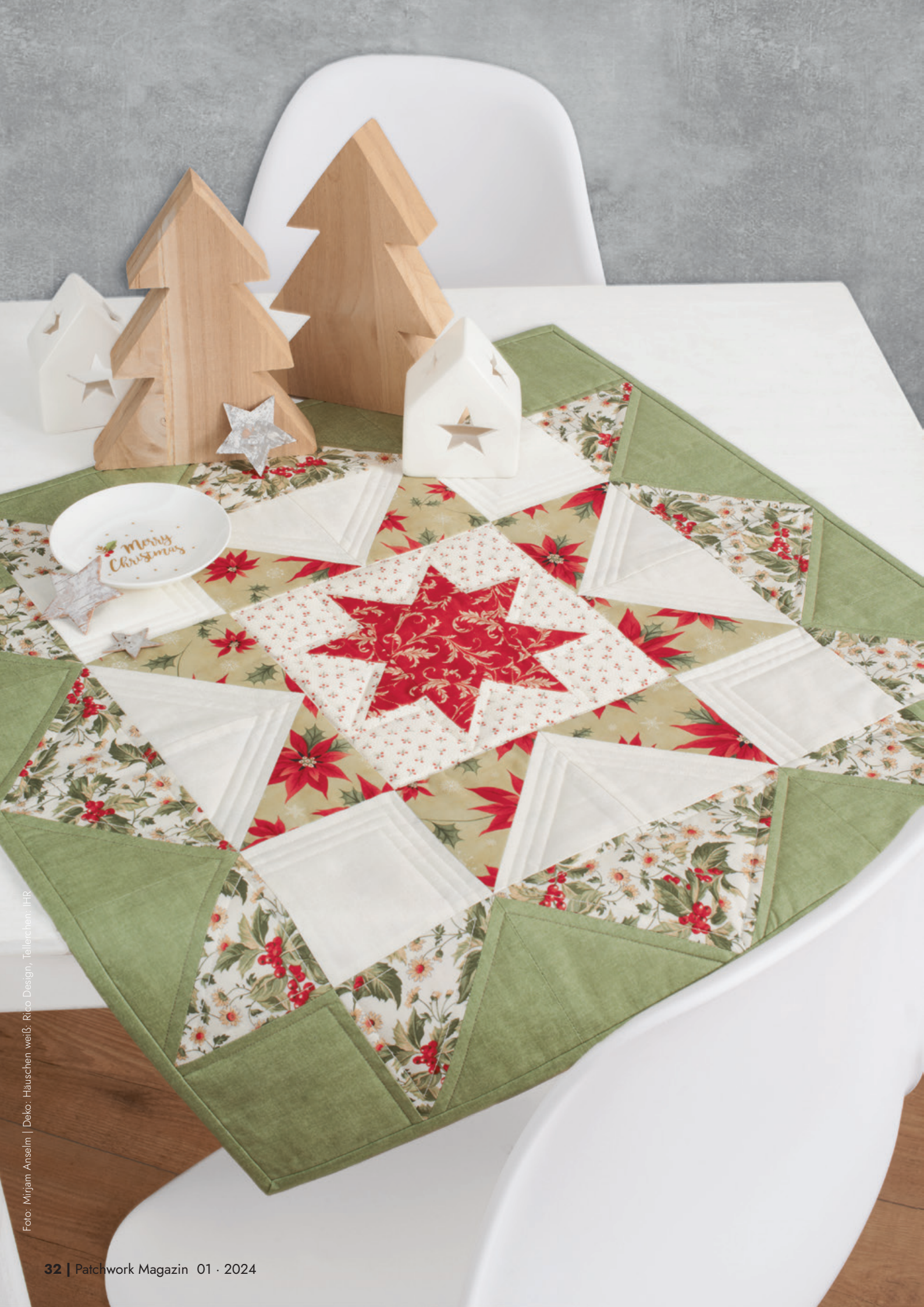
Deko: Häuschen weiß, Rico Design, Tellerchen, IHR