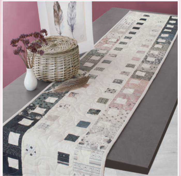
Lace and Pepper – Tischläufer von Susann Fischer-Popiel