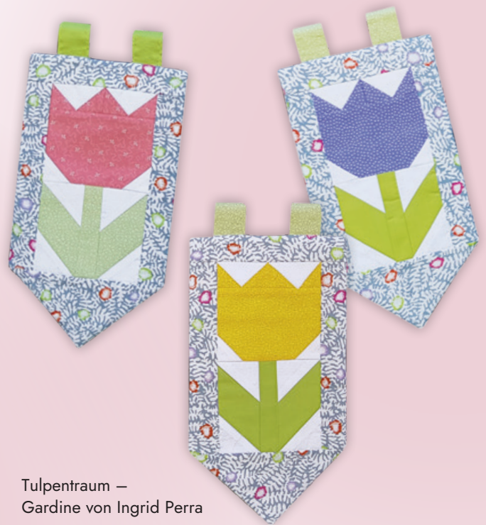
Tulpenraum – Gardine von Ingrid Perra