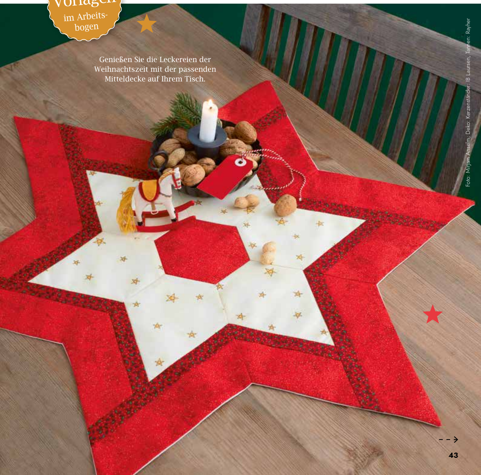
Deko: Kerzenständer: IB Laursen, Tannen: Rayher

Genießen Sie die Leckereien der Weihnachtszeit mit der passenden Mitteldecke auf Ihrem Tisch.