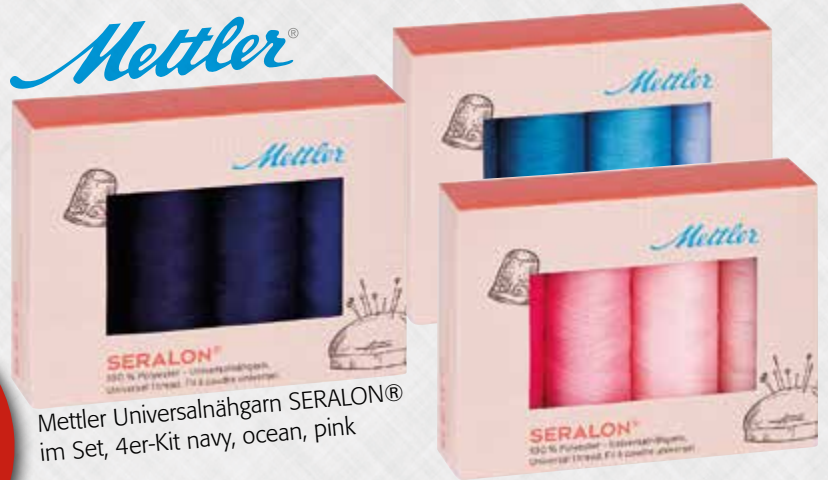
Mettler Universalnähgarn SERALON® im Set, 4er-Kit navy, ocean, pink

Ihre Vorteile auf einen Blick: 10 % sparen , Prämie wählen und kostenlose Lieferung