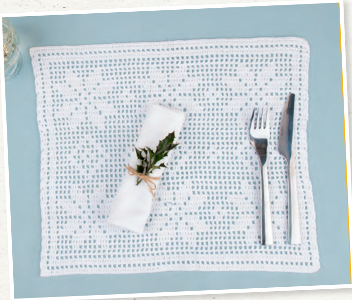
Dieses feine Häkeltischset wird Ihre Gäste verzaubern.

NR. 03/2023 ERSCHEINT AM 14. OKTOBER 2023