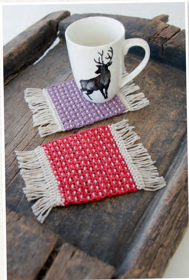
Verpassen Sie auf keinen Fall diese kleinen Tassenuntersetzer -ideal auch als Geschenk geeignet.