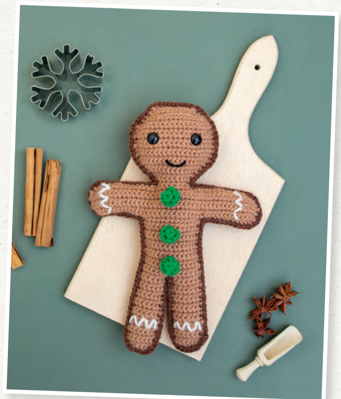
Ein zuckersüßer Lebkuchenmann -Einfach zum Anbeißen.