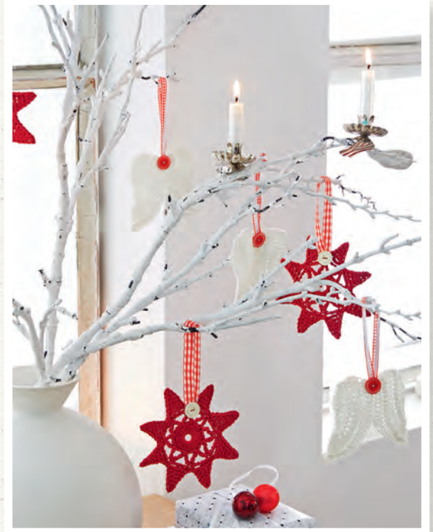
Kleine weihnachtliche Schneeflöckchen - egal ob als Deko oder für den Weihnachtsbaum.